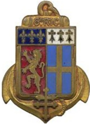
Insigne du 6 e Rgt d'Infanterie coloniale (6e RIC)